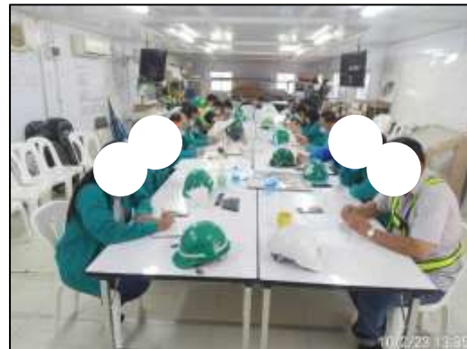
ภาพที่ 57 Safety Meeting