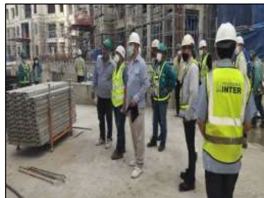
ภาพที่ 58 การเดินตรวจหน่วยงานก่อสร้าง