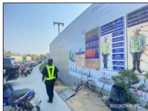
ภาพที่ 48 เจ้าหน้าที่ตรวจสอบและดูแลสภาพรั้วชั่วคราว