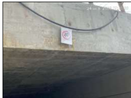
ภาพที่ 51 ป้ายสัญญาณจราจร