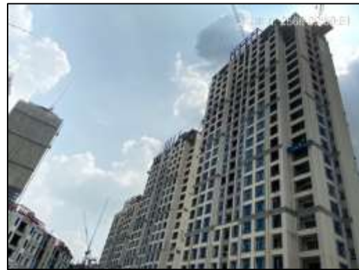
ภาพที่ 1 สภาพโครงการปัจจุบัน