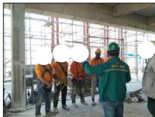
ภาพที่ 52 กิจกรรมอบรมการใช้อุปกรณ์ป้องกันอันตรายส่วนบุคคล