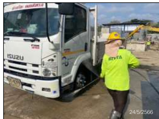
ภาพที่ 11 กิจกรรมทำความสะอาดล้อรถก่อนเข้าโครงการ