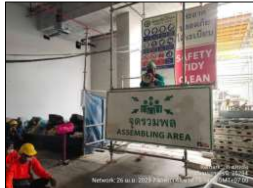
ภาพที่ 56 Morning Talk