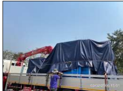
ภาพที่ 10 ใช้ผ้าใบปิดคลุมท้ายกระบะบรรทุก