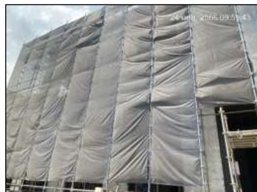
ภาพที่ 13 ติดตั้ง Mesh Sheet