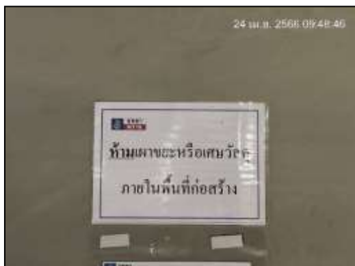
ภาพที่ 12 ป้ายเตือน “ห้ามเผาขยะ หรือเศษวัสดุ