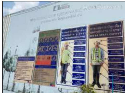
ภาพที่ 46 ป้ายแสดงกฎระเบียบปฏิบัติในพื้นที่โครงการ