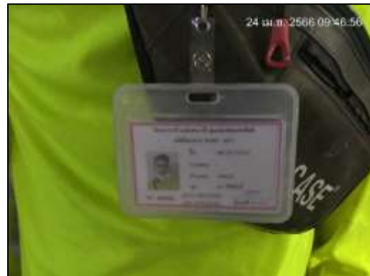
ภาพที่ 47 ชุดฟอร์มพนักงาน และบัตรพนักงาน