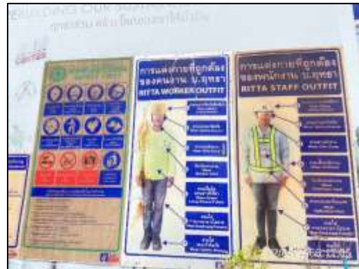
ภาพที่ 50 ป้ายเตือนพื้นที่ที่ต้องสวมอุปกรณ์ป้องกันอันตรายส่วนบุคคล