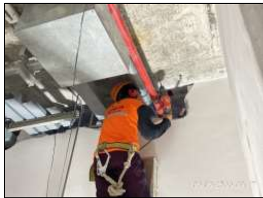
ภาพที่ 60 พนักงานสวมใส่ Ear Muff