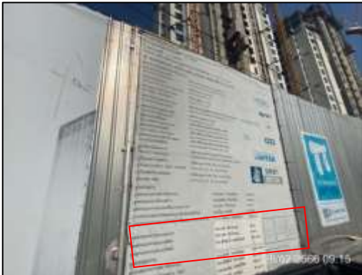
ภาพที่ 59 วิศวกรควบคุมดูแลก่อสร้างโครงการ