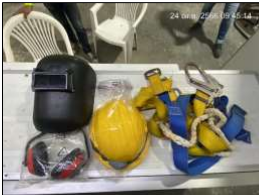
ภาพที่ 49 อุปกรณ์ป้องกันอันตรายส่วนบุคคล