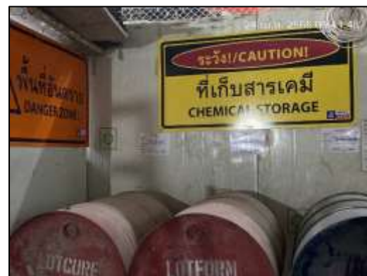
ภาพที่ 3 ป้ายเตือนอันตรายต่าง ๆ ภายในพื้นที่โครงการ