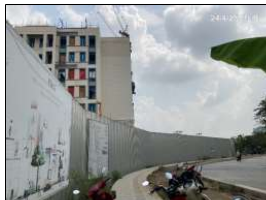
ภาพที่ 2 รั้วชั่วคราวรอบพื้นที่โครงการ